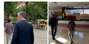
Au 285, le Centre socio culturel d'Endoume.

"Ceux qui vivent sont ceux qui luttent" - Victor Hugo