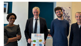
avec l'association Allô Alzheimer !

Je réitérerai mon soutien aux associations pendant la période budgétaire, en travaillant des amendements avec les associations marseillaises pour protéger des subventions essentielles à leur bon fonctionnement.